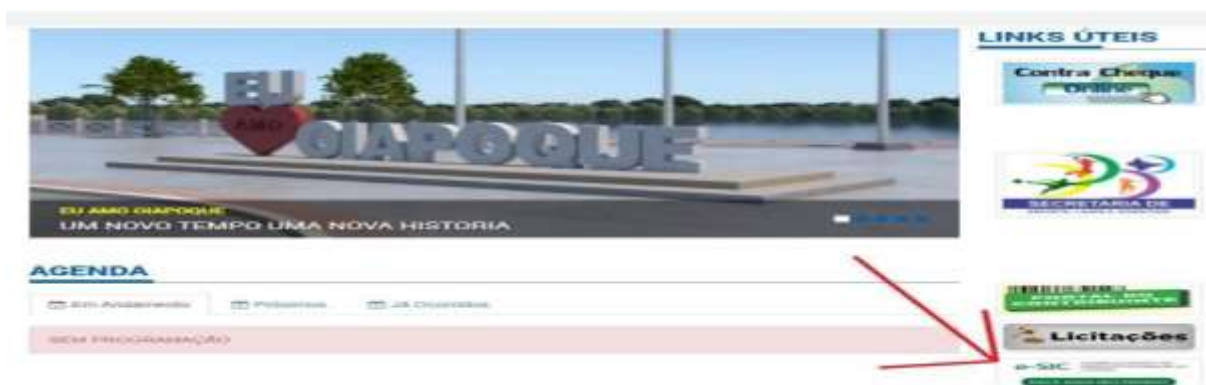
Figura 2: Portal da Prefeitura de Oiapoque

Já o item 05 que pergunta sobre a possibilidade do cidadão apresentar o pedido de informação por meio de formulário eletrônico, ressalta que não existe área de acesso à informação como já citado no item 03, embora seja possível visualizar o campo do E-sic conforme pode ser observado na Figura 2: