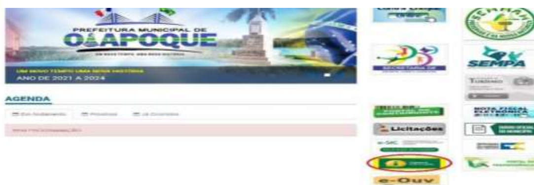
Figura 2: Site oficial PMO 2021

Porém, foi identificado que no link há um redirecionamento para o link