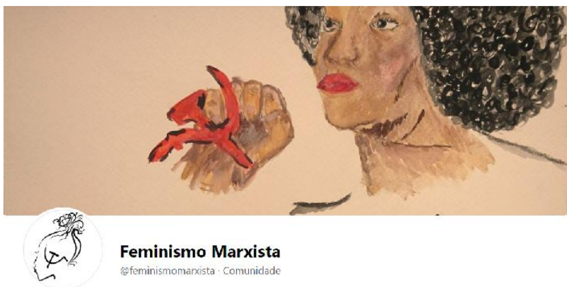
Figura 2: Imagens da capa e do perfil da página Feminismo Marxista.