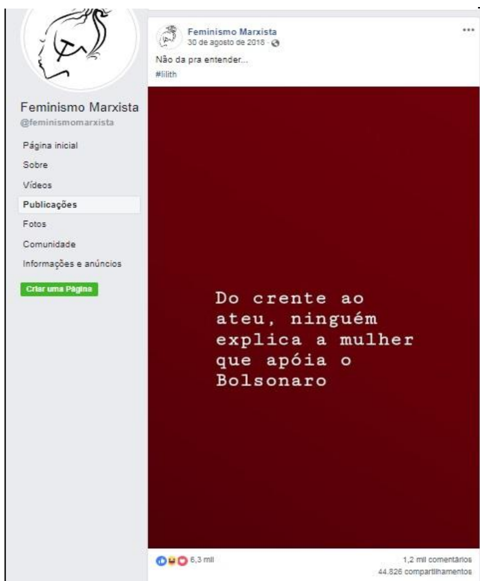
Figura 4: Publicação da página sobre o tema Política.