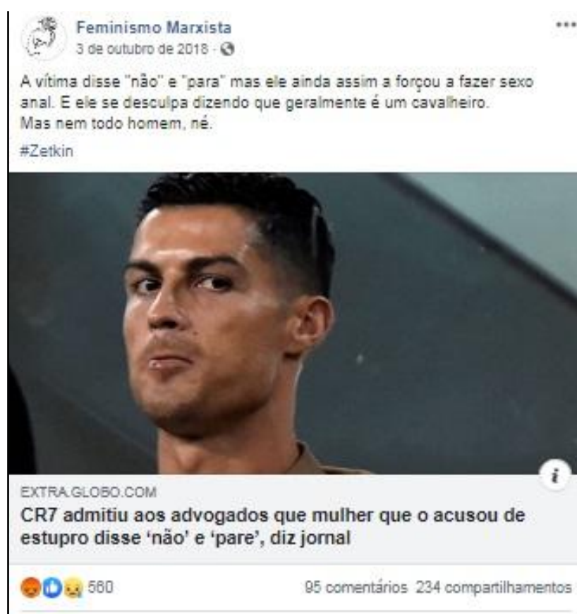
Figura 5: Reportagem sobre violência sexual de Cristiano Ronaldo.