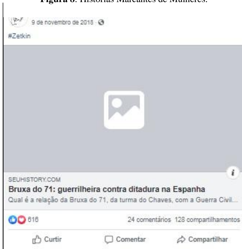
Figura 8: Histórias Marcantes de Mulheres.