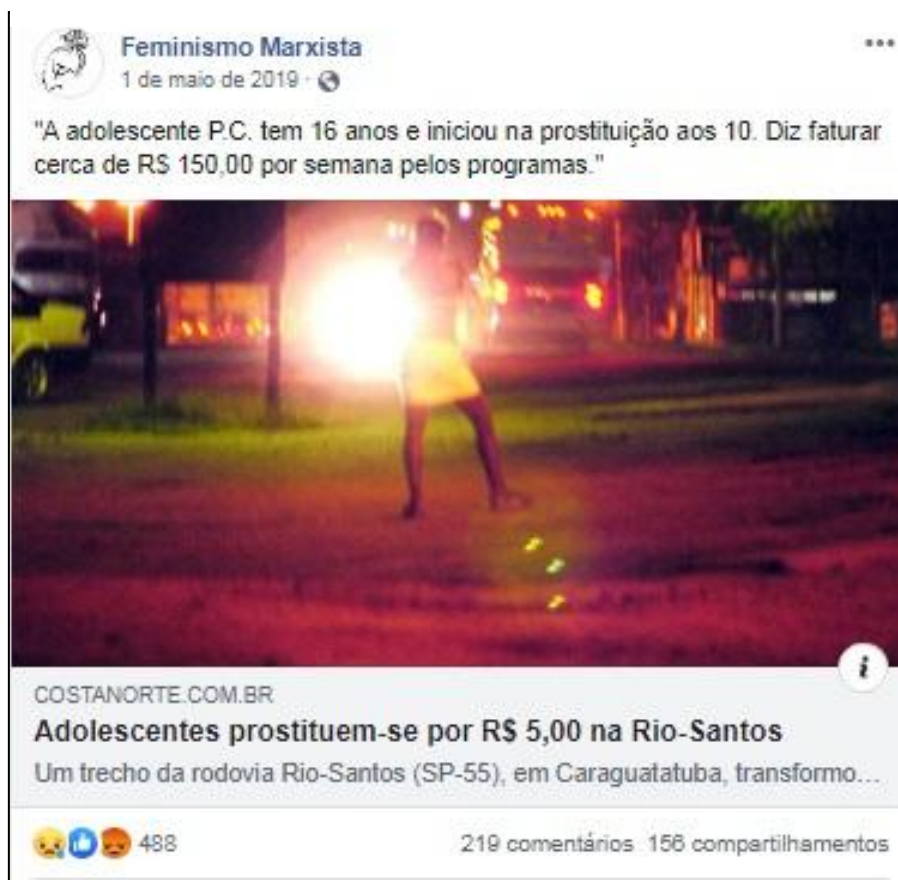
Figura 6: Questão social.