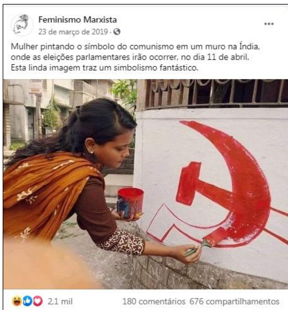
Figura 7: Abordagens relacionadas ao comunismo e marxismo.