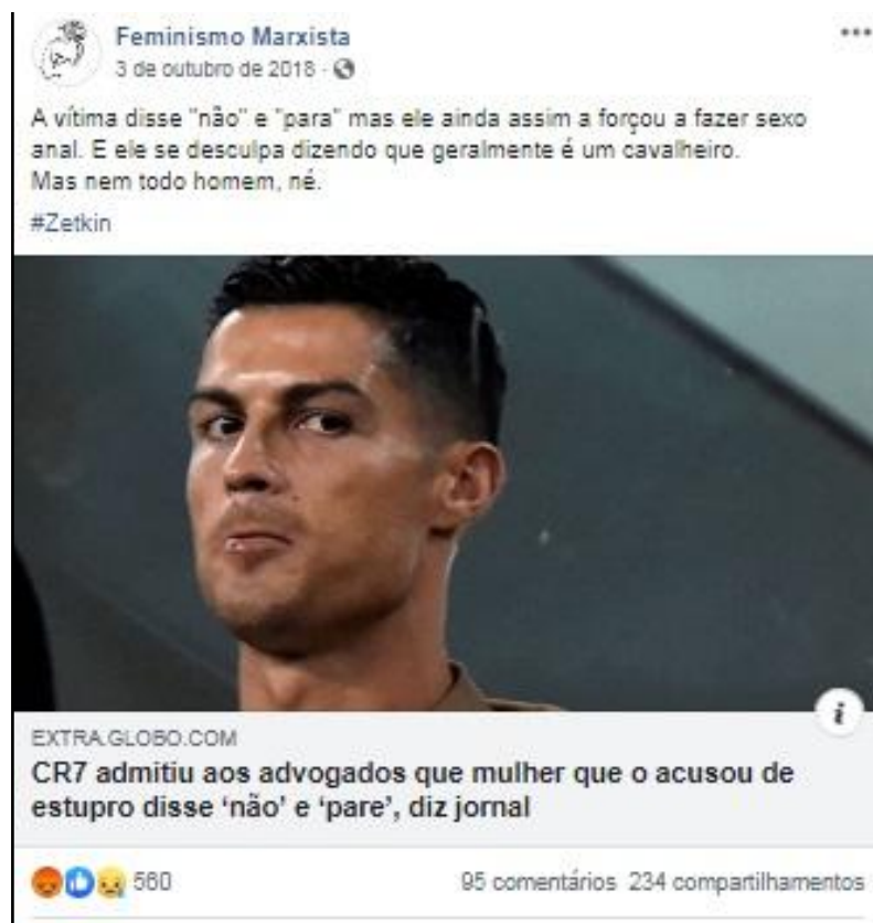
Figura 5: Reportagem sobre violência sexual de Cristiano Ronaldo.