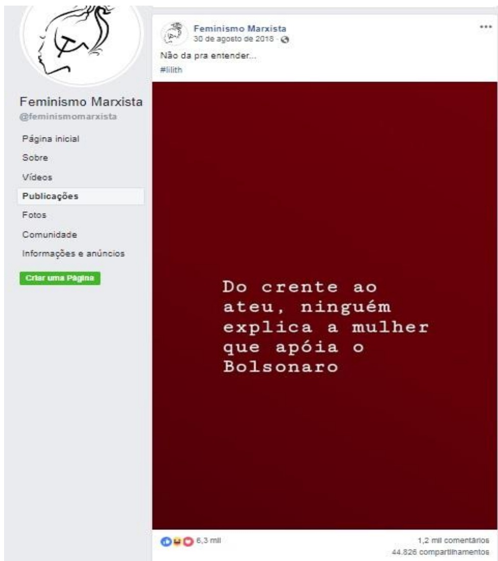
Figura 4: Publicação da página sobre o tema Política.