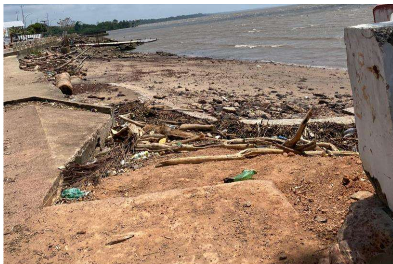
Figura 4: Local de coleta na orla do Perpétuo Socorro

No bairro do Perpétuo Socorro, a coleta das amostras foi realizada na orla do Perpétuo Socorro (Figura 4), nas seguintes coordenadas geográficas: 0.051138^\circ (latitude); -51.040936^\circ (longitude).