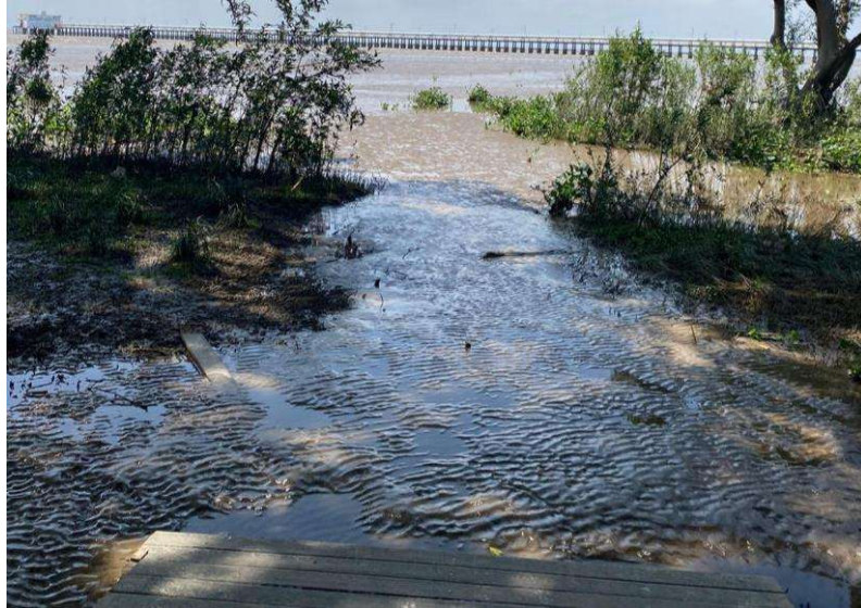
Figura 3: Local de coleta na orla do Santa Inês

No bairro do Santa Inês, a coleta das amostras foi realizada na orla do Santa Inês (Figura 3), nas seguintes coordenadas geográficas: 0.0020461^\circ (latitude); -51.049088^\circ (longitude).