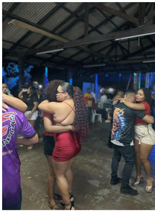
Imagem 11 - Público dançando durante a festa “o encontro do século”