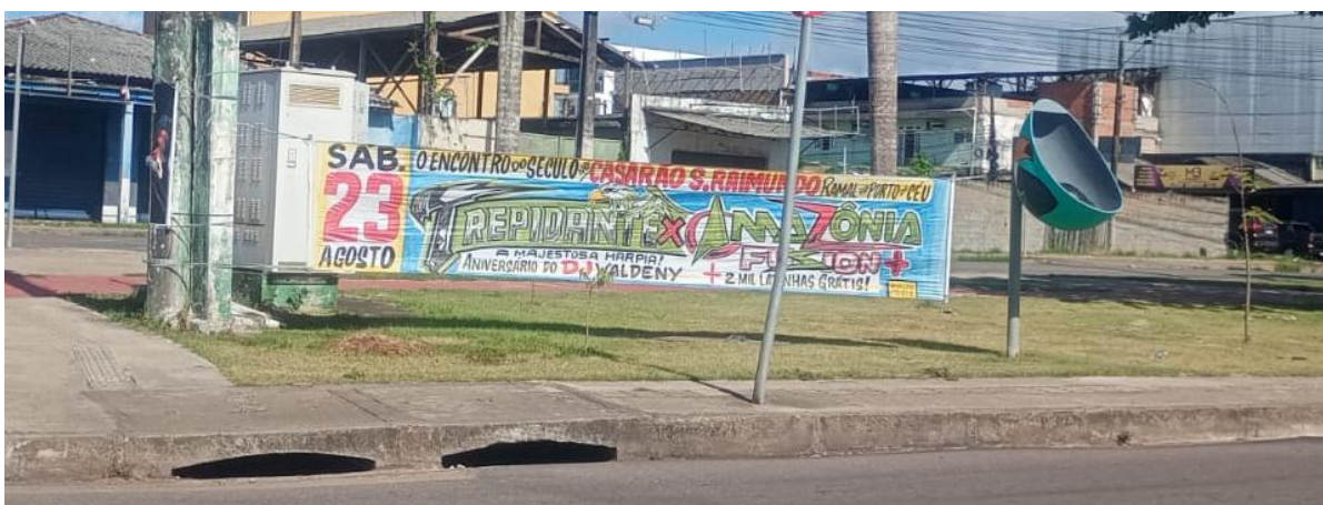
Imagem 5 – Faixa da festa em comemoração do aniversário do DJ Waldeny