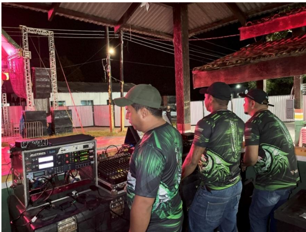
Imagem 8- A mesa de som e luz do Trepidante A Majestosa Harpia