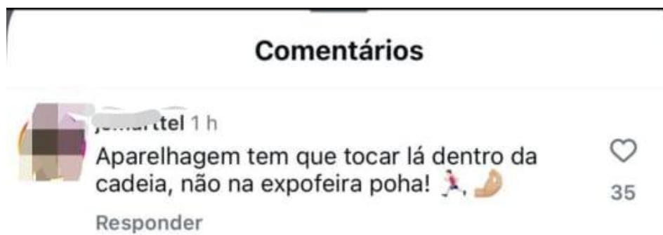
Imagem 4- Print de comentário feito no Instagram