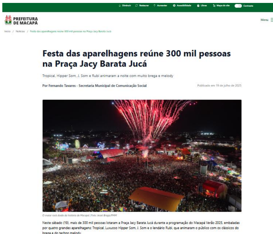
Figura 1 – Notícia sobre o público da Festa das Aparelhagens em Macapá/AP