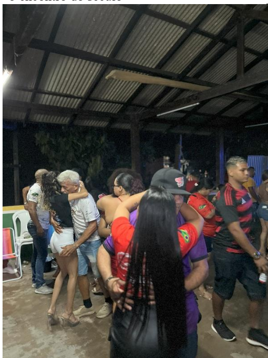
Imagem 12 - Público dançando durante a festa “o encontro do século”