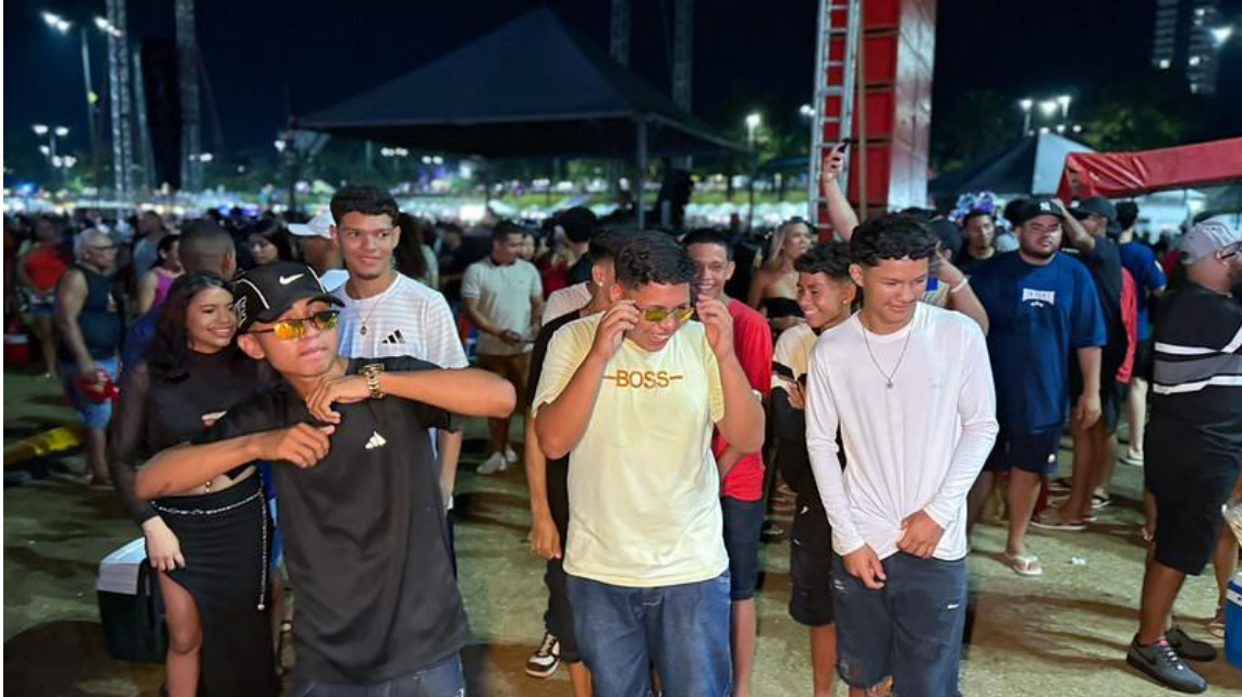
Imagem 6 – Registro da festa das aparelhagens do “Macapá Verão 2025”