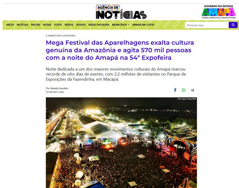
Figura 2- Notícia sobre o público do Mega Festival das Aparelhagens no Amapá