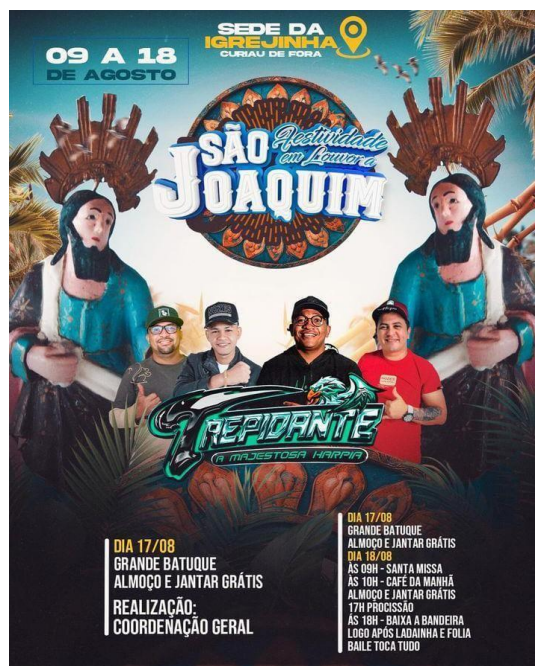
Imagem 2- Encarte da participação da aparelhagem na Festividade de São Joaquim