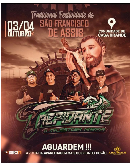
Imagem 3- Encarte da participação da aparelhagem na Festividade de São Francisco de Assis