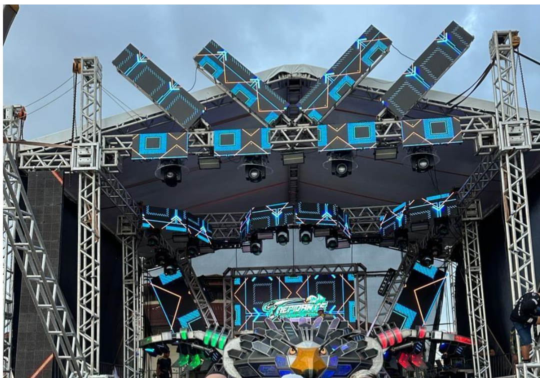
Imagem 1- Foto do Trepidante