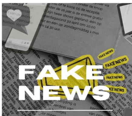
Fake news são uma problemática crescente na sociedade. Arte : Lilian Marceley

Nos últimos anos, o estado do Amapá tem enfrentado um fenômeno que ultrapassa os limites do ambiente virtual e gera efeitos concretos nas ruas, escolas e instituições públicas: a propagação de fake news. O compartilhamento de informações falsas, especialmente em redes sociais e aplicativos de mensagens, tem afetado a plena segurança da população.