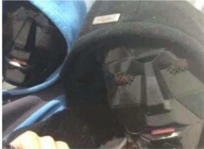
Alunos fizeram transmissão com ameaças a escola.

Segundo o oficial da Delegacia de Repressão aos Crimes Cibernéticos do Estado (DRCCIBER), Adel da Silva, 152 ocorrências foram registradas entre os anos de 2021 e 2025. Essas práticas podem enquadrar-se em tipos penais já previstos na legislação brasileira, demonstrando que, embora se trate de um fenômeno contemporâneo, ele encontra respaldo jurídico em normas já existentes.