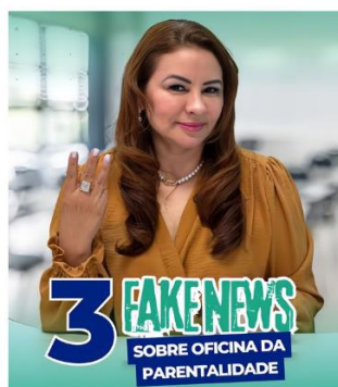
O TJAP adota medidas de enfrentamento às fake news.

Com o agravamento da situação, instituições estaduais passaram a adotar medidas mais efetivas no combate às notícias falsas. O Tribunal de Justiça do Amapá (TJAP), por exemplo, criou um quadro mensal nas redes sociais chamado “3 fake news e como combatê-las”, com o objetivo de esclarecer a população sobre conteúdos enganosos.