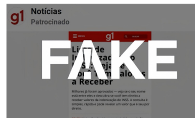
Quadro fato ou fake do G1 analisa os casos de Fake News.