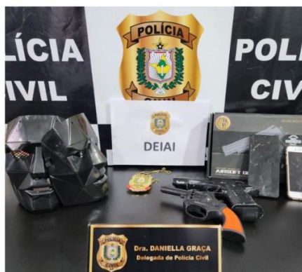
Materiais utilizados durante a transmissão na internet foram apreendidos.

Entre os episódios que mais repercutiram na sociedade amapaense, destaca-se a circulação de boatos, em abril de 2023, acerca de supostos ataques à Escola Barão do Rio Branco, situada no centro de Macapá. Mensagens de áudio e vídeos disseminados em aplicativos como WhatsApp e Instagram anunciavam atentados em massa contra a instituição, os quais nunca se concretizaram. Diante da situação, foram adotadas medidas emergenciais de segurança, tais como a emissão de carteiras estudantis para controle de acesso, monitoramento rigoroso do fluxo de alunos, instalação de botão de