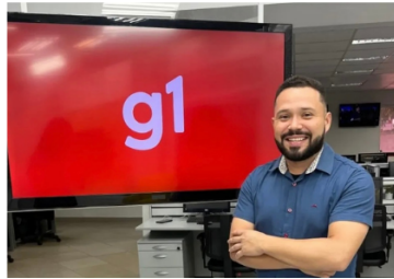
Jornalismo de checagem ajuda a desmentir boatos em tempo real.