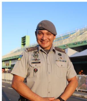
A Polícia Militar também atua no combate às fake news.