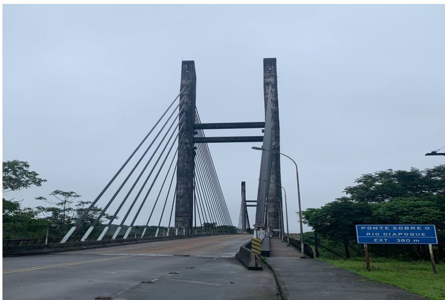
Figura 3 - Ponte Binacional entre o Brasil e Guiana Francesa (2022)