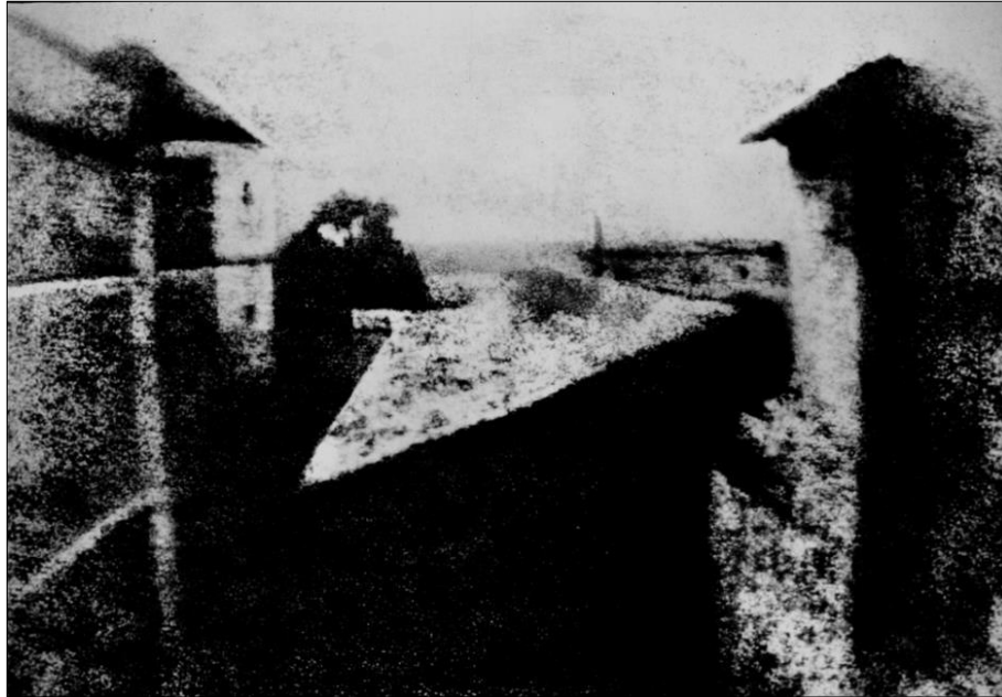
Figura 1: Vista da janela em Le Gras (1826), Joseph Nicéphore Niépce

Fonte: Disponível em https://incinerrante.com/textos/vista-da-janela-em-le-gras-1826-7-de-joseph-nicephore-niepce/