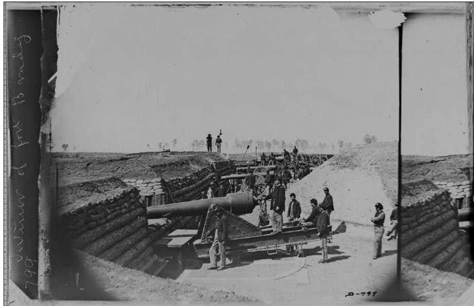
Figura 2: Guerra Civil Americana, soldados no campo de batalha, de Mathew Brady

Fonte: Disponível em: https://www.pristina.org/fotografia/mathew-brady-fotografando-a-guerra-civil-americana/