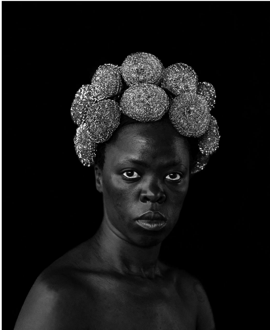
Figura 6: Por Zanele Muholi

Fonte: Zanele Muholi at Isabella Stewart Gardner Museum