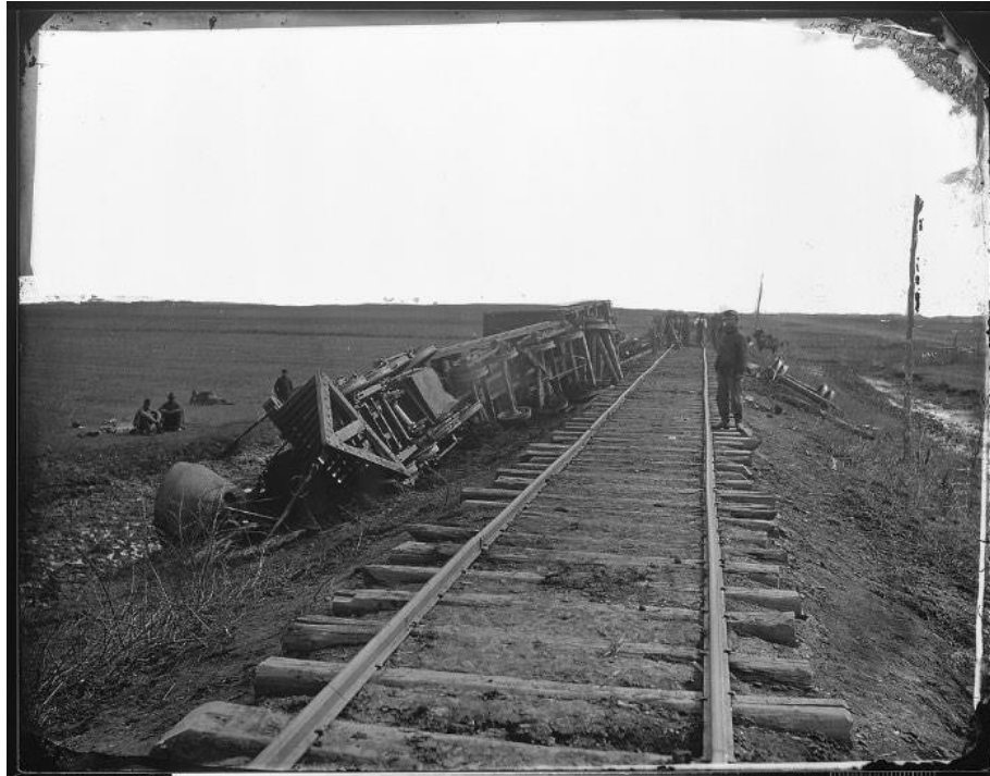
Figura 3: Guerra Civil Americana, locomotiva avariada, de Mathew Brady