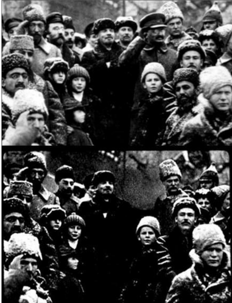
Figura 8: O apagamento de Trotsky