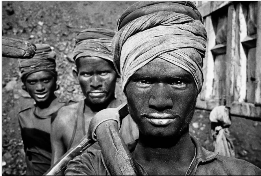
Figura 7: Por Sebastião Salgado