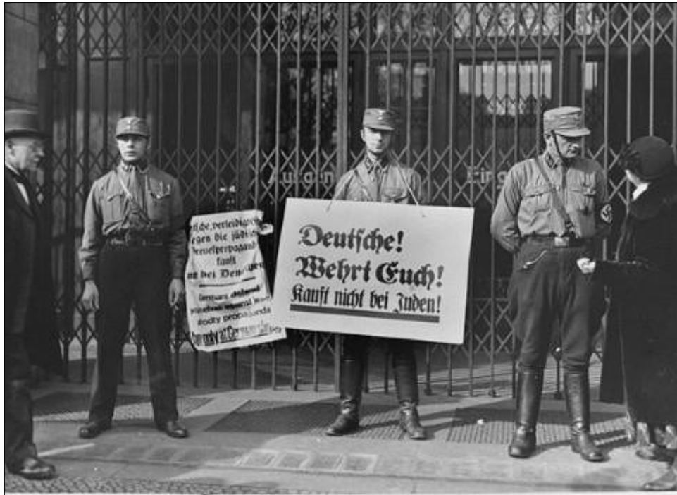
Figura 5: Membros das Tropas de Choque (SA), com cartazes de boicote, bloqueando a entrada de uma loja de propriedade de judeus