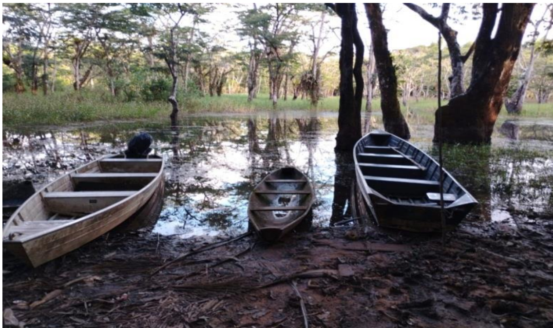
Imagem 06: Um dos portos da aldeia Manga.

Geralmente são os homens adultos que realizam a caça, pois essa atividade é feita em regiões de floresta dentro da reserva Uaçá. Já a pesca pode ser realizada por crianças, jovens e adultos, tanto homens quanto mulheres; é comum a prática da pesca no rio e em igarapés, principalmente no verão amazônico. Os meios de transporte utilizados para a pescaria estão dispersos pelos portos da aldeia, podendo ser a canoa, feita em madeira pelos indígenas que possuem a habilidade de construir, e também há algumas “voadeiras” com motor de popa (imagem 06). O uso de ambos os transportes depende da distância em que o pescador precisará se deslocar e da quantidade de pessoas que irão; no entanto é mais comum o uso da canoa tradicional, frequentemente usada como meio de transporte das famílias.