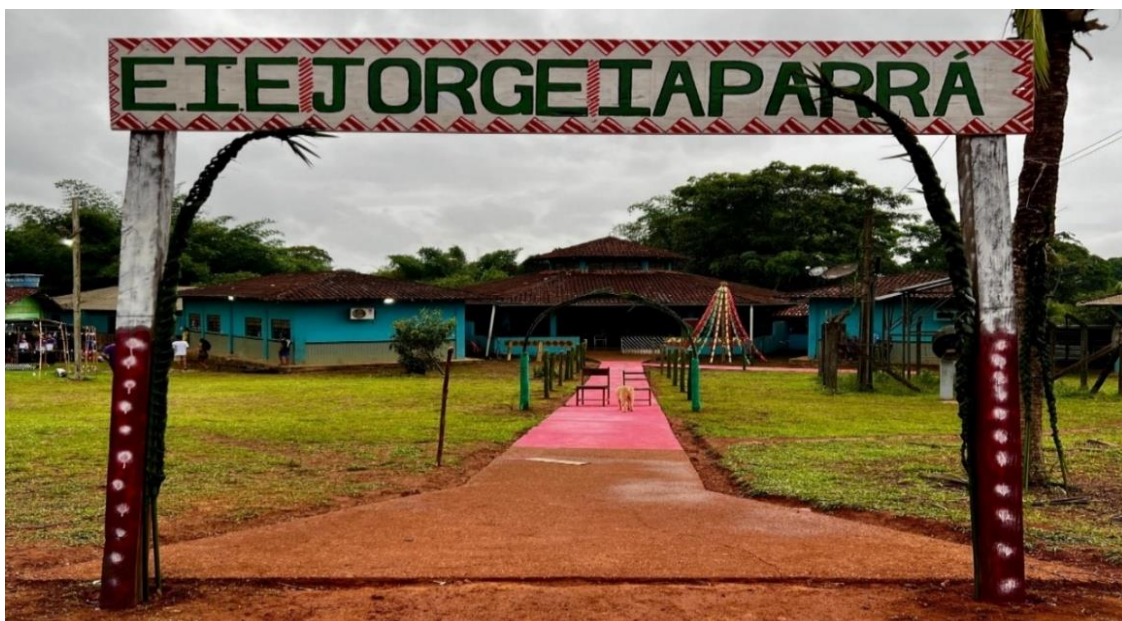
Imagem 02: Frente da E.E.I. Jorge Iaparrá, dezembro, 2023.

O Projeto Político Pedagógico (PPP) da E.I.E. Jorge Iaparrá foi atualizado em 2024 (em parceria dos professores, direção e pedagogos), e aguarda aprovação pelo Conselho Estadual de Educação. O documento apresenta as ações e metas que o corpo pedagógico da escola pretende alcançar a curto, médio e longo prazo. Com base nos dados disponíveis neste documento, é possível identificar as ações que estão sendo desenvolvidas e as que se pretendem desenvolver. Contudo, podemos compreender o principal objetivo da escola, enquanto instituição que atende os Karipuna da Aldeia Manga, através do seguinte aspecto ressaltado no documento: