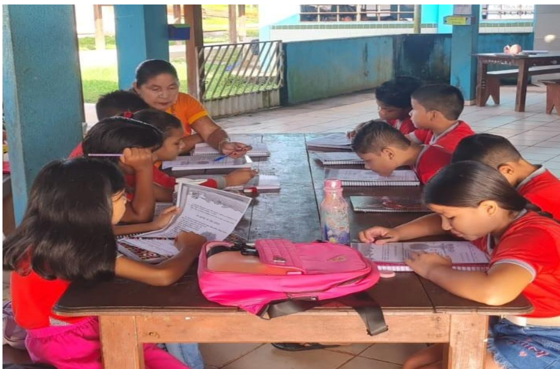
Imagem 12. Turma do 3º ano em aula no refeitório da escola.

Ressaltamos que a metodologia de observação participante prevista para o início do ano letivo, no mês de fevereiro, foi adiada devido às obras de reforma e ampliação do prédio escolar, o que provocou o atraso nas aulas presenciais das turmas escolhidas para a realização da pesquisa. Sendo assim, somente a partir do início do mês de março que as aulas retornaram. A imagem 12 mostra os alunos do 3º ano A usando o espaço do refeitório para as aulas.