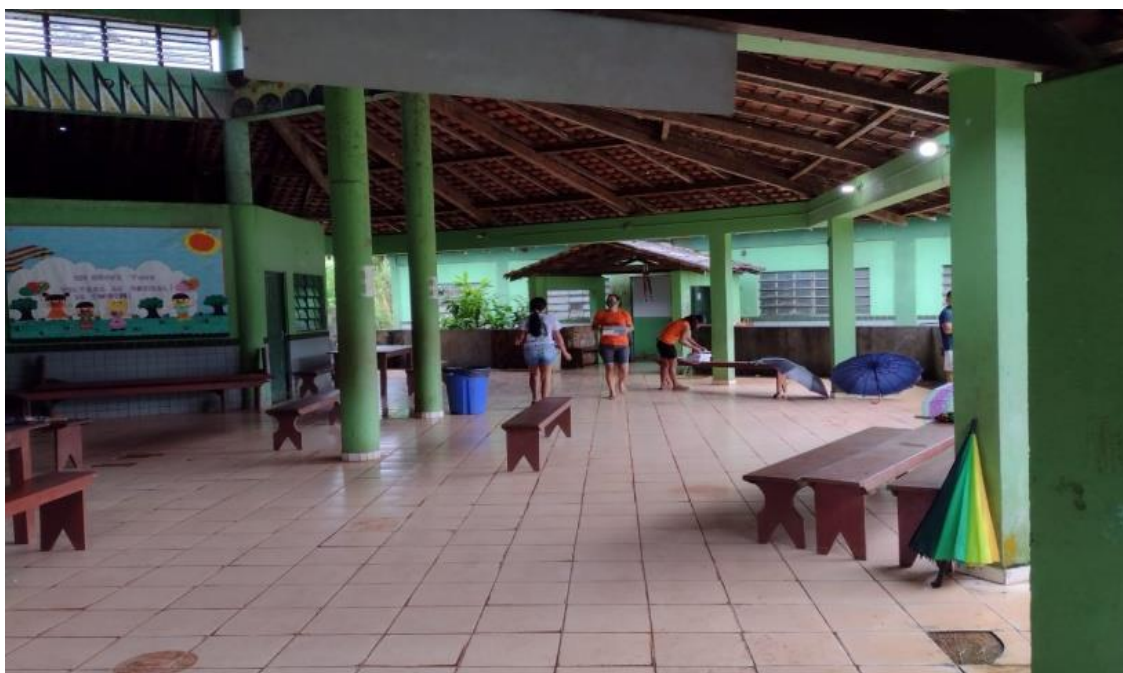
Imagem 10: refectório e área de circulação da escola.

A reforma do prédio escolar iniciou no segundo semestre de 2024, e neste mesmo período a educação infantil começou a ser atendida pelo município de Oiapoque, em um espaço alugado pela Prefeitura. Com essa mudança de estado para município, a E.I.E. Jorge Iaparrá teve uma diminuição em seu quantitativo de alunos novos matriculados na instituição, pois todo início de ano letivo havia público para iniciar os estudos na educação infantil. E outra situação que contribuiu com a diminuição de alunos foi a conclusão da turma do 3º ano do ensino médio. Portanto o ano de 2024 apresentou mudanças significativas em comparação com os anos interiores, onde o número de alunos atendidos pela escola diminuiu, passando a ter uma queda em número de matrículas de alunos novos, como podemos verificar no quadro abaixo.