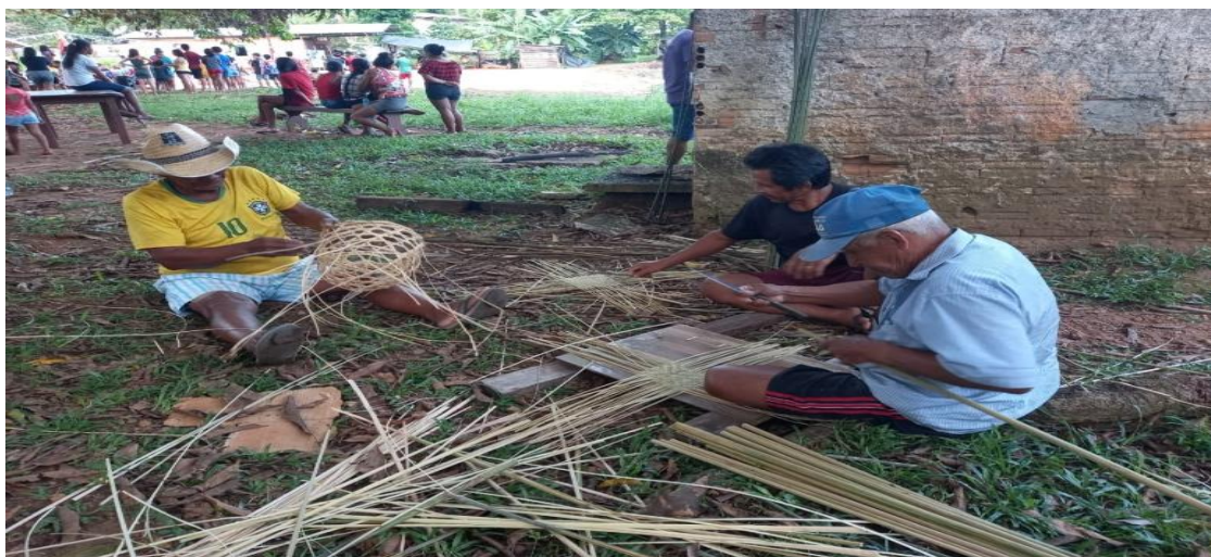
Imagem 07, artesãos demonstram as técnicas de tecelagem com o uso de cipó.

Além da agricultura familiar, podemos citar outros meios que as famílias da aldeia Manga mantêm culturalmente e que geram renda. A produção de artesanatos como: colares, pulseiras, brincos, adereços de cabelo, cocar, cuias, cestarias e outros. São produzidos geralmente por mulheres; no entanto, alguns objetos como o txipitxi , a peneira e o paneiro, somente alguns artesãos anciãos que possuem a habilidade nesta atividade. Na imagem 07 alguns artesãos fazem demonstração de tecelagem com o uso de cipó e guarumã para confeccionarem objetos; na imagem 08 um senhor artesão mostra as técnicas utilizadas na tecelagem para os alunos durante a semana cultural da E.I.E. Jorge Iaparrá.