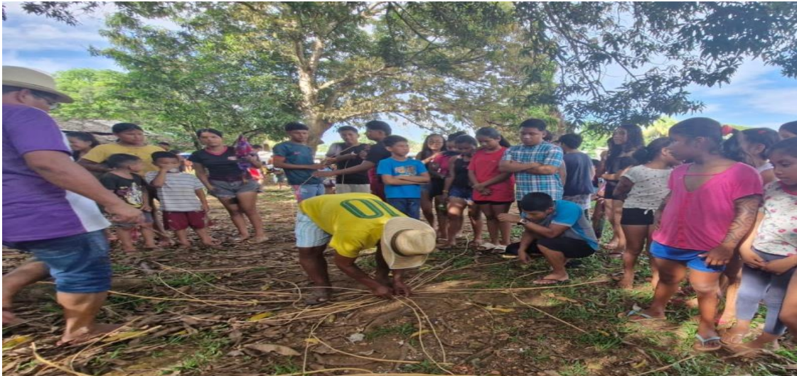
Imagem 08.

Os conhecimentos que os mais velhos possuem são passados de pai para filho, é através da observação e da oralidade que tais conhecimentos vão sendo transmitidos. Desde a infância nós indígenas já somos inseridos nas atividades cotidianas no ambiente familiar e também em atividades realizadas na aldeia. Nos maiuhi de plantar a roça, por exemplo, cada integrante da família tem uma função; os senhores de idade cortam as manivas 16 que são carregadas até o local da roça por rapazes; as crianças levam os feixes de manivas já cortadas para as moças que aguardam para colocar nas covas; essas covas são feitas pelos homens adultos; e as mulheres adultas são responsáveis em concluir a plantação fechando as covas com as manivas.