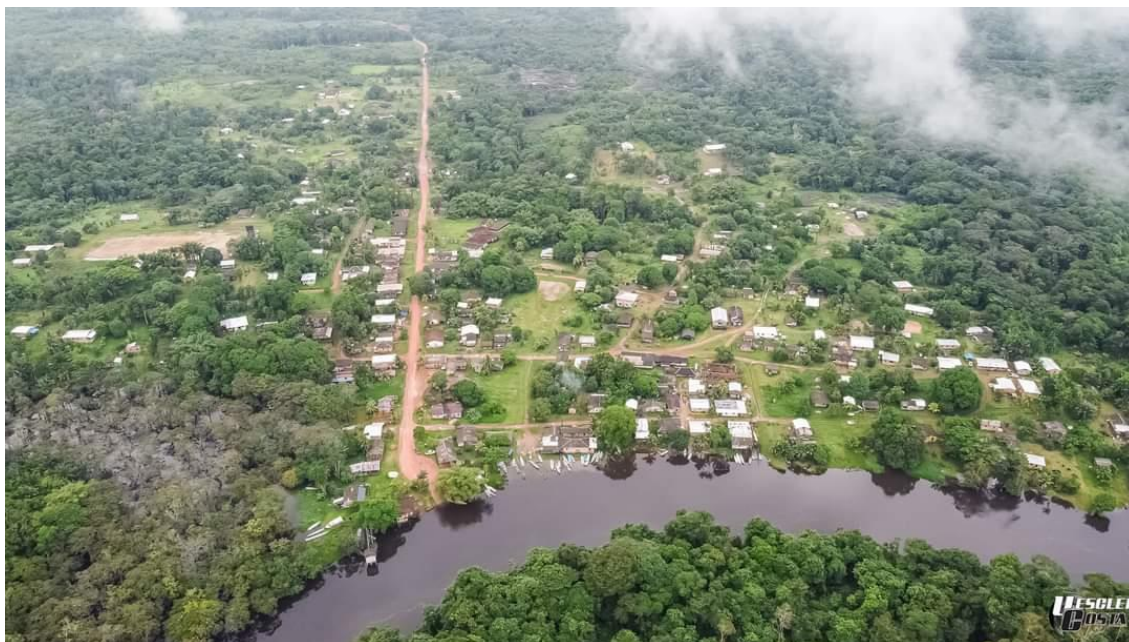
Imagem 01: Vista aérea da Aldeia Manga.

A imagem 01 mostra uma vista aérea da aldeia Manga, onde podemos observar o Rio Curipi e o ramal de acesso a Br-156.