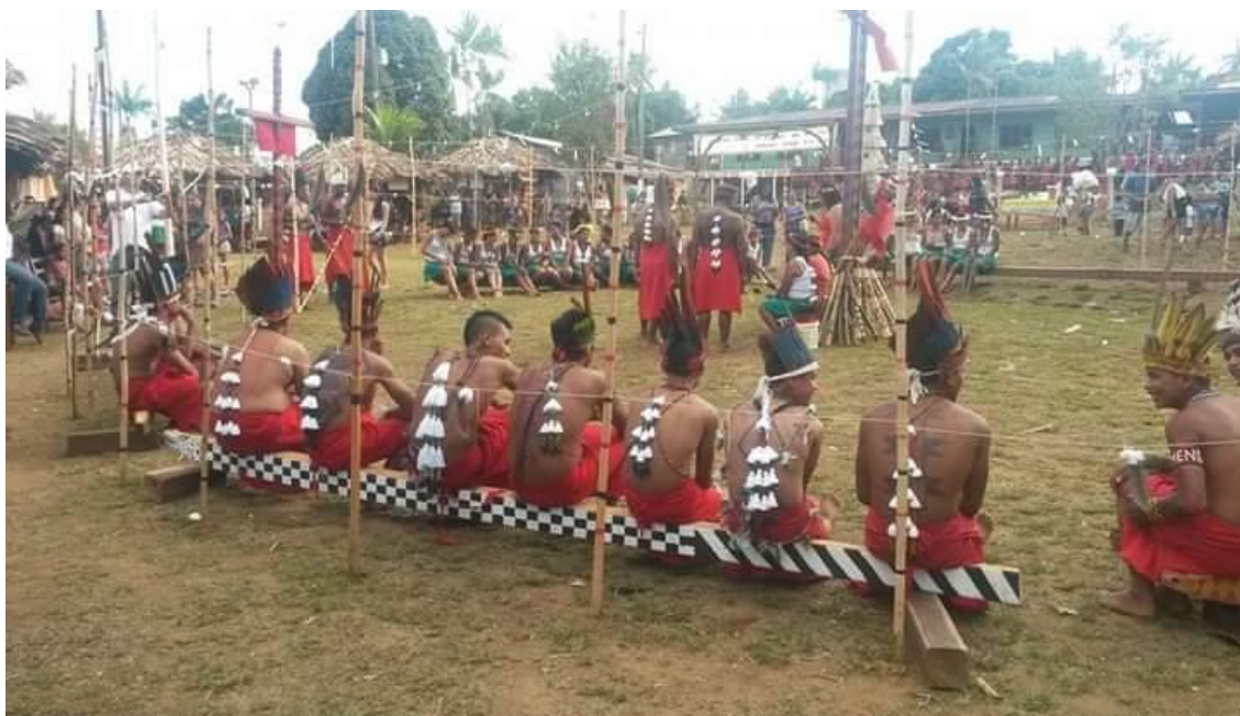
Imagem 03: alunos da E.I.E. Jorge Iaparrá. Fonte: Arquivo pessoa da autora, Aldeia Manga, 2013.

A cada ano que passa a realização da Semana Cultural atrai visitantes de outras localidades, indígenas ou não. Podemos perceber na imagem 04, alunos do Ensino Médio realizando uma demonstração do ritual do turé há exatamente dez anos após o turé da imagem anterior.