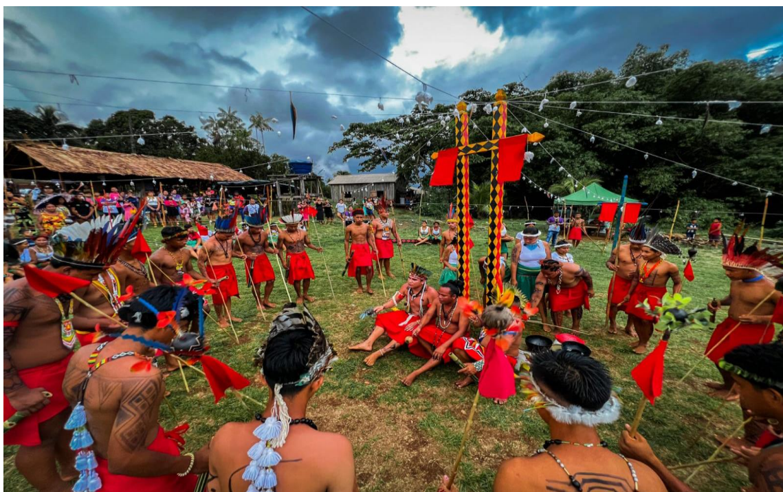
Imagem 04: Alunos da E.I.E. Jorge Iaparrá.

A cada ano que passa a realização da Semana Cultural atrai visitantes de outras localidades, indígenas ou não. Podemos perceber na imagem 04, alunos do Ensino Médio realizando uma demonstração do ritual do turé há exatamente dez anos após o turé da imagem anterior.