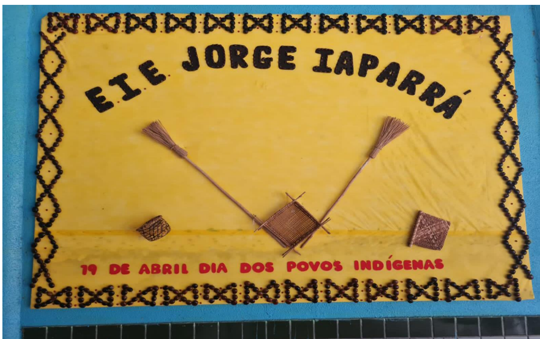
Imagem 11: mural construído pelos professores da E.I.E. Jorge Iaparrá. Fonte: arquivo da autora, 2019.

uma reflexão crítica, justificada por várias situações vivenciadas no passado pelos povos indígenas.